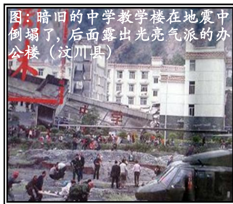
图：暗旧的中学教学楼在地震中倒塌了，后面露出光亮气派的办公楼（汶川县）

愿国人都能穿越暴力和谎言，快快的明白真相，获得属于自己的东西，过上真正幸福的日子。◇