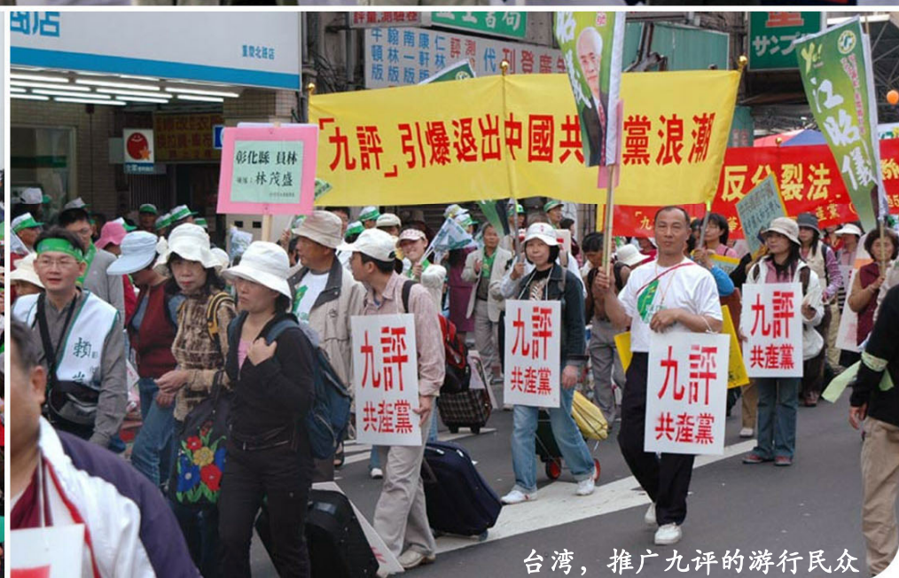
台湾，推广九评的游行民众