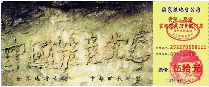
(上图为贵州省平塘县风景区门票)

历代的败象，都没有腐败到如此猖狂；历代的灭亡，都要带走它的追随者殉葬。当天灭中共的劫难降临之时，不要怨上天没有预警：奇石就是明证。