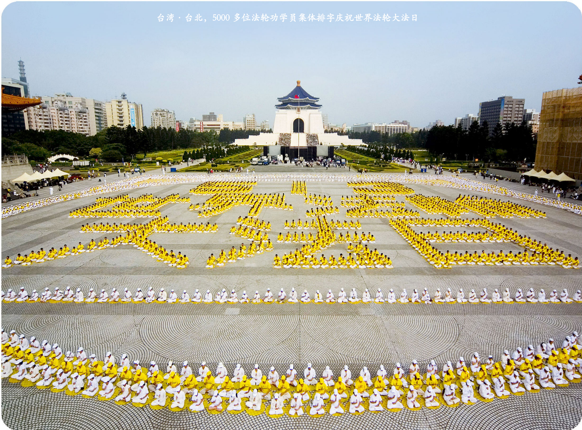
台湾·台北，5000 多位法轮功学员集体排字庆祝世界法轮大法日