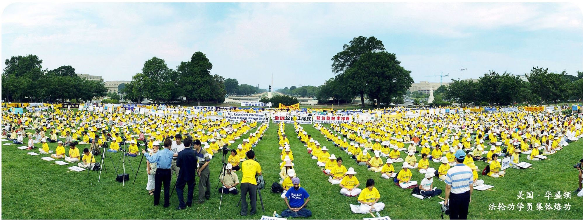
美国·华盛顿 法轮功学员集体炼功