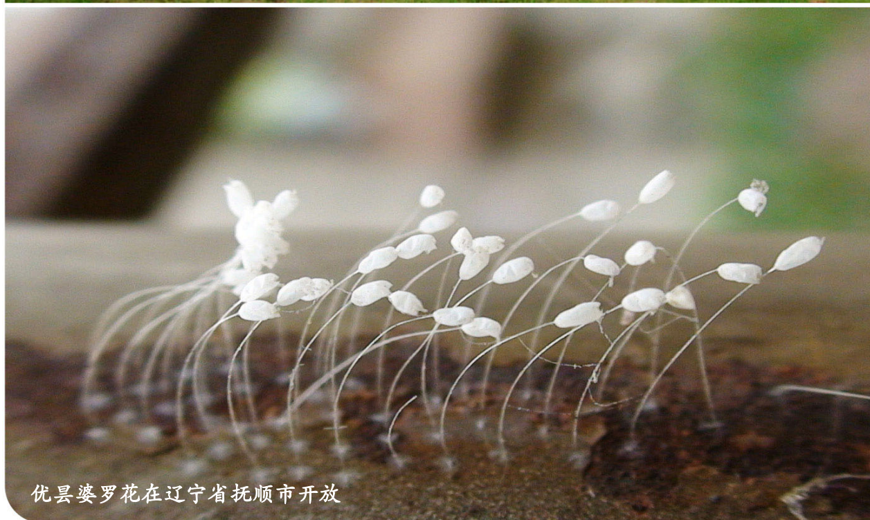
优昙婆罗花在辽宁省抚顺市开放