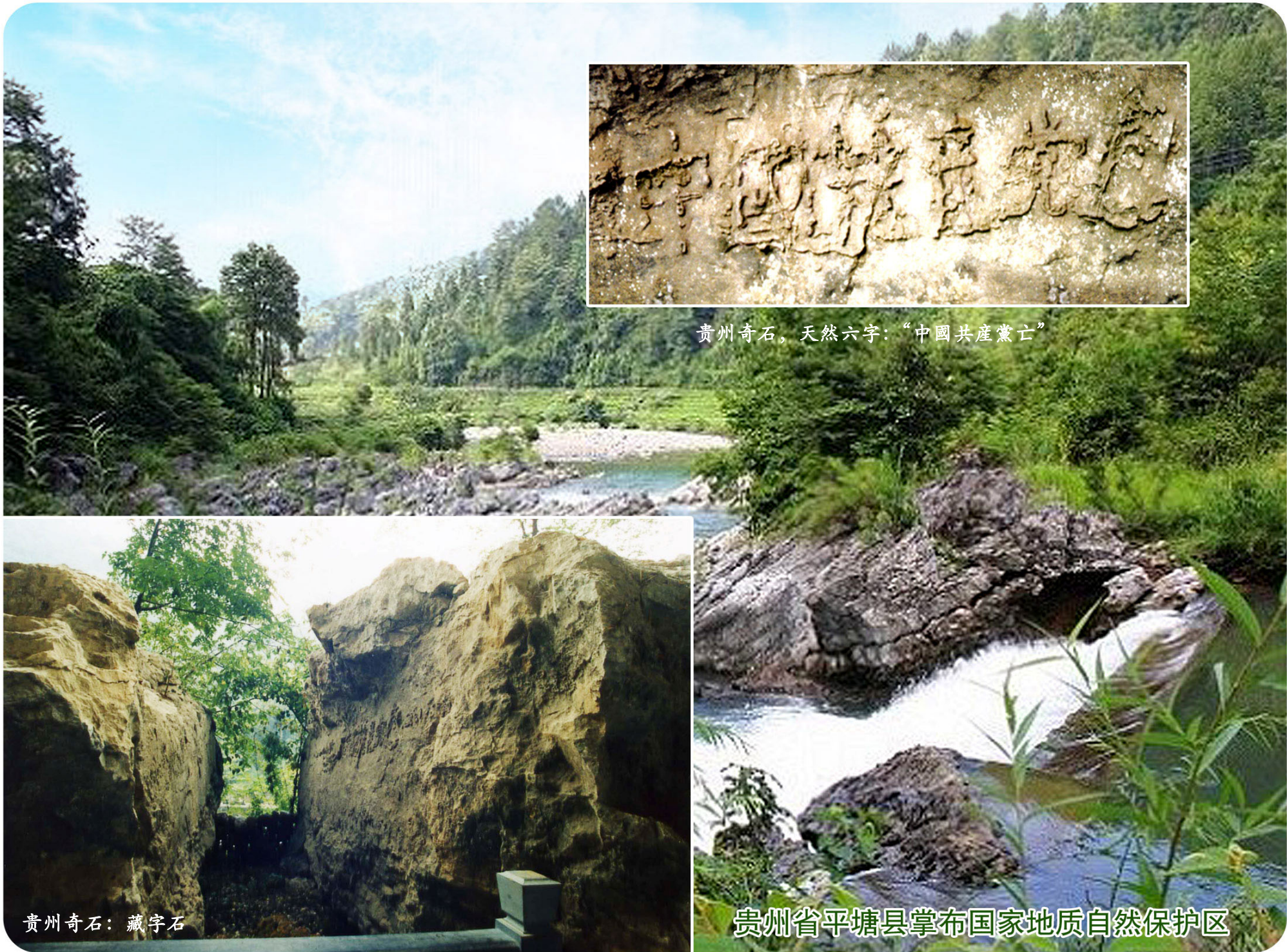
贵州奇石，天然六字：“中國共產黨亡”