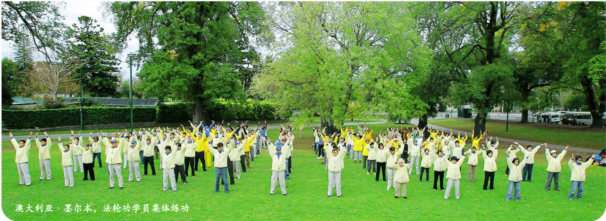
澳大利亚·墨尔本，法轮功学员集体炼功