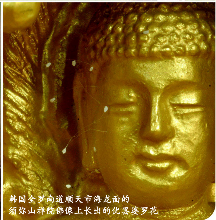
韩国全罗南道顺天市海龙面的 须弥山禅院佛像上长出的优昙婆罗花