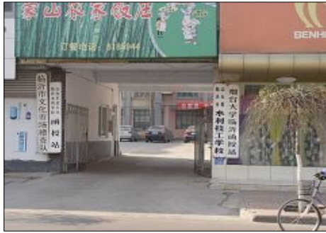
临沂市 610 洗脑班 (临沂市水利技校沿沂州路大门)

(明慧网通讯员山东报道)早在二零零一年,中共临沂市委在市水利技校学生宿舍区耗资三十多万元,修建两排瓦房,共二十多间,建起了“临沂市法制教育培训中心”(实为对法轮功学员进行劫持洗脑的非法私设监狱,下称洗脑班),迫害法轮功学员。同时派出了以宋伟为首的“学习考察团”,