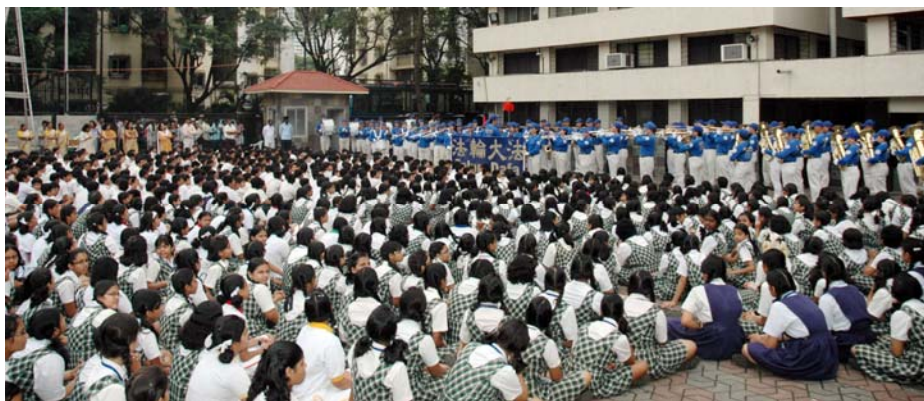
法轮功学员组成的亚太天国乐团应邀在多所私立学校中演出

【明慧周报】印度千所绩优学校校长年会，于二零一零年十一月二十四及二十五日二天在西南滨海经济大城孟买召开，由台湾、新加坡、马来西亚及日本等国的法轮功学员组成的亚太百人天国乐团应邀演出。