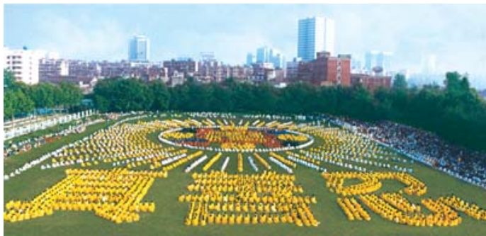
历史图片：1997 年武汉 5000 多名法轮功学员集体炼功，列队组字，法轮图形和“真善忍”。

自一九九九年开始，中共在大陆残酷迫害法轮功学员，迄今已造成至少三千四百多名学员死亡，成千上万的学员被非法劳教、关押，被迫害致伤致残、失学、失业、流离失所、家破人亡。而在海峡对岸同样承传华夏文化的台湾，法轮功却呈现蓬勃发展的景象，一千多个炼功点遍及全台湾三百多个乡镇，连外岛的澎湖、金门、马祖都有十几个炼功点。不仅在清晨的公园里可以看到法轮功学员的身影，许多政府机关、大学校园也常见法轮功学员的炼功画面。◇