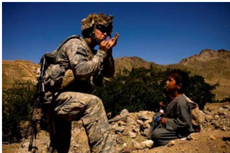
图: 新闻纪实类金奖作品《阿富汗》

戴兵说, 这幅作品, 有着云、天和彩虹的对比, 同时把大草原的辽阔表现得非常好。由远至近的羊群, 远处的草原, 和整个的天空, 非常和谐地搭配在一起, 像一幅油画。天是暗的, 像一个天幕一样, 整个地把彩虹衬托出来, 属天时、地利、人和, 是一幅可遇而不可求的瞬间作品。◇