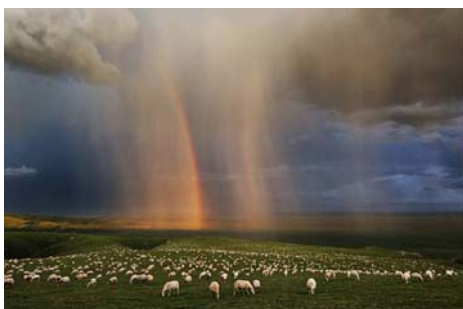
图: 自然风光类金奖作品《高原奇观》