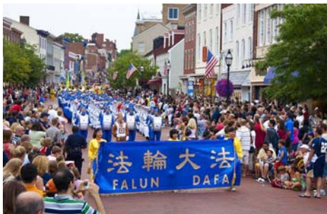
图: 社会生活类金奖作品《希望之路》