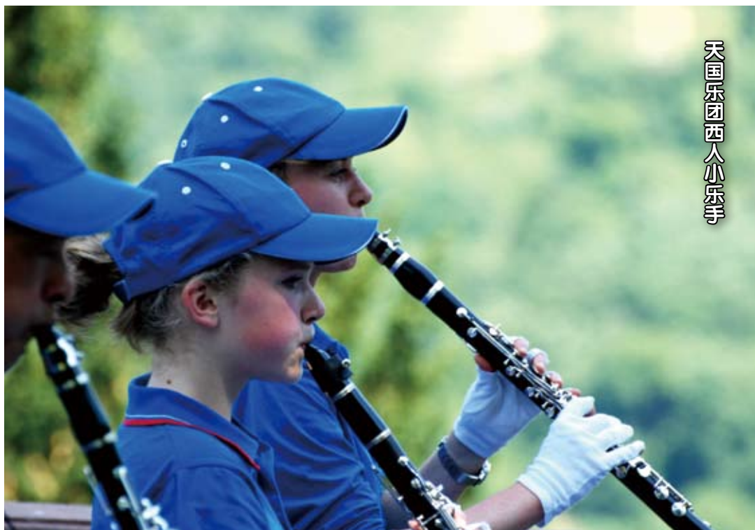
天国乐团西人小乐手

2006年1月28日农历新年除夕，纽约皇后区法拉盛举办的庆祝新年游行中，由一百多名法轮功学员组成的“天国乐团”首次亮相，备受瞩目。这支由大鼓、小鼓、长短笛、竖笛、萨克斯风、小号、长号、法国号、各式低音号等10多种乐器组合而成的庞大队伍气势雄伟。嘹亮的乐音、整齐的步伐，祥和的风貌，震惊在场观看的民众，也赢得了观众阵阵掌声及喝彩。