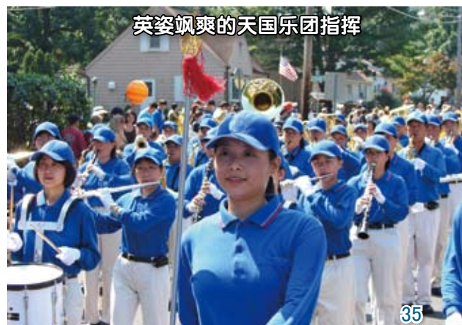
英姿飒爽的天国乐团指挥