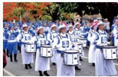
P34 天国乐团的天籁清音