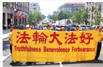
P10 法轮功华府反迫害游行