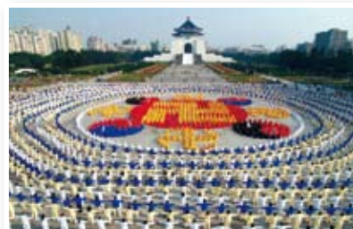
P22 法轮大法 光耀台湾