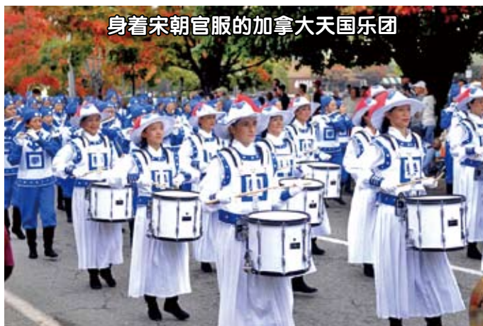
身着宋朝官服的加拿大天国乐团