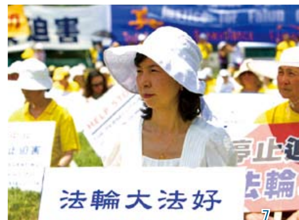
左图：位于国会山庄西草坪上的集会现场主席台 右上：参加集会的法轮功学员 右中：参加集会的法轮功学员 右下：参加集会的法轮功学员