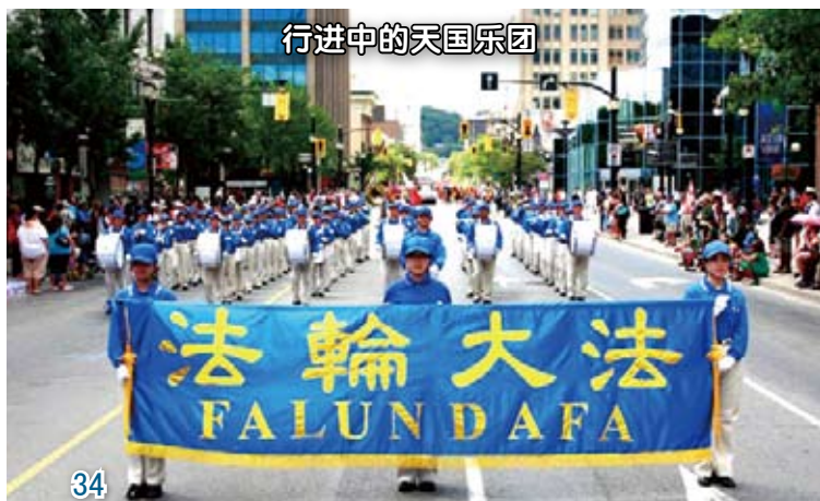
行进中的天国乐团

四年多来，加拿大、澳大利亚、新西兰、日本、韩国、新加坡、马来西亚、台湾、欧洲等国家、地区，也都相继成立了“天国乐团”，使得“天国乐团”成为全世界人数最多、声势最浩大的军乐团。这群看似儒雅的修炼者，通过乐曲的演奏，把修炼人纯善的精神境界和纯正的能量传达给了世人，震撼着民众的心。