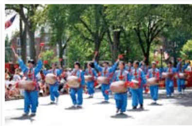
P26 独立日游行 法轮功受欢迎