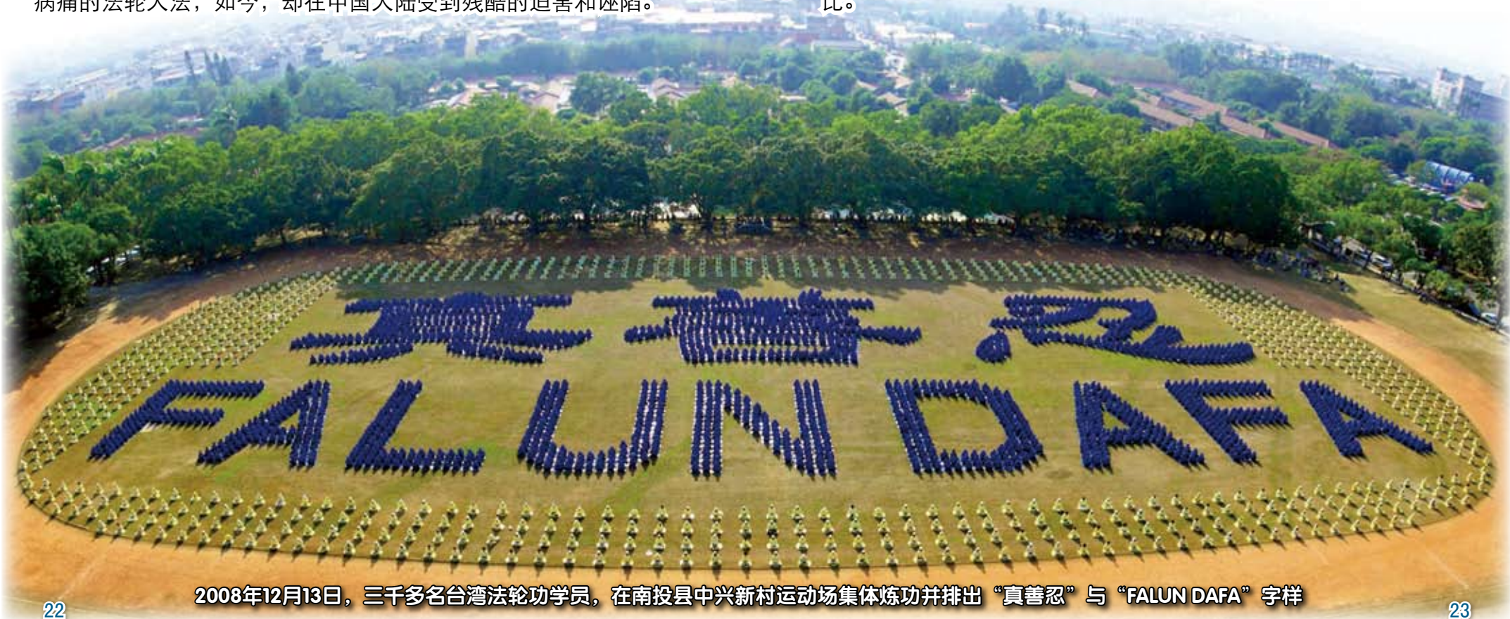
2008年12月13日，三千多名台湾法轮功学员，在南投县中兴新村运动场集体炼功并排出“真善忍”与“FALUN DAFA”字样

十一年来，台湾法轮功学员也相继以横幅标语、真相传单、游行集会、烛光夜悼、反酷刑演示、新闻发布会、文艺演出等多种方式向大陆、台湾及各国民众锲而不舍地讲真相，启发人们的善念良知，共同来制止这场灭绝人性的迫害。现在，台湾民众普遍支持法轮功、声援反迫害，海峡两岸对待法轮功的态度形成了鲜明的对比。