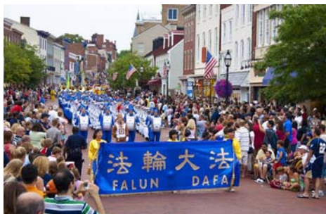
图：社会生活类金奖作品《希望之路》