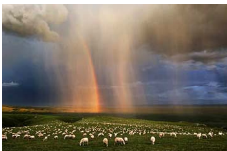
图：自然风光类金奖作品《高原奇观》