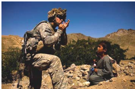
图：新闻纪实类金奖作品《阿富汗》

戴兵说，这幅作品，有着云、天和彩虹的对比，同时把大草原的辽阔表现得非常好。由远至近的羊群，远处的草原，和整个的天空，非常和谐地搭配在一起，像一幅油画。天是暗的，像一个天幕一样，整个地把彩虹衬托出来，属天时、地利、人和，是一幅可遇而不可求的瞬间作品。◇