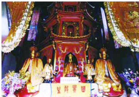
图:九华山的肉身殿

出现肉身不腐、虹化等奇异现象的高僧和民间修行者,都有一个共同特点:品性温良,乐于助人,一生勤于修德。现代科学发现生命有多种存在形式,那么这些修行者的肉体在人间达到了不朽,他们真正的生命形式