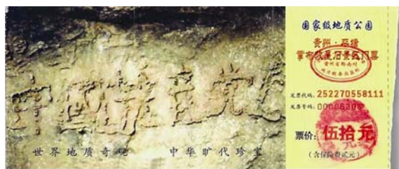
图：位于贵州省平塘县掌布风景区内的救星石景区的“藏字石”，石头上清晰可见的六个字是：中国共产党亡（此图为风景区门票）。

【明慧网】孔子是我国春秋时期的思想家、教育家，非常重视道德教化，善于从普通的事物或者现象中发现隐含其中的道理，善化他人。他通过对最平常的水的观察、感悟和思考，以伦理道德思想为切入点，来阐发对水的深刻理解和认识，给人以智慧的启迪。