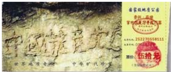
图：位于贵州省平塘县掌布风景区内的救星石景区的“藏字石”，石头上清晰可见的六个字是：中国共产党亡（此图为风景区门票）。

【明慧网】孔子是我国春秋时期的思想家、教育家，非常重视道德教化，善于从普通的事物或者现象中发现隐含其中的道理，善化他人。他通过对最平常的水的观察、感悟和思考，以伦理道德思想为切入点，来阐发对水的深刻理解和认识，给人以智慧的启迪。