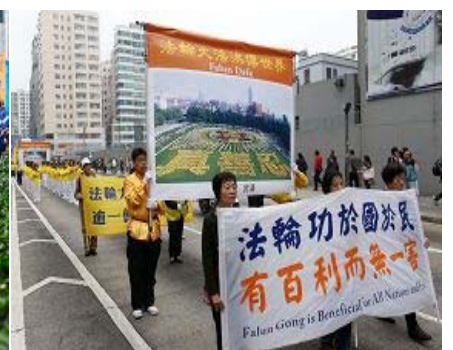
左图:多名社会各界知名人士在集会上发言 中图:法轮功学员的天国乐团游行队伍 右图:展示法轮大法弘传图片