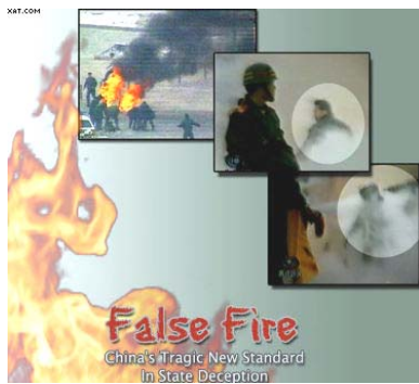
图：揭露天安门自焚骗局的国际获奖纪录片《伪火》也在大陆媒体上被插播

最近，法轮功学员在大连交通广播电台成功插播法轮功真相，中共当局对真相的这种呈现方式极为恐慌。2002 年，法轮功学员首次在吉林省长春市电视网成功插播《法轮大法洪传世界》、《是自焚还是骗局》等真相电视片，轰动了整个长春。后来在全国不同地方陆续发生不同规模的零星电视插播事件。每次真相在大陆民众中大规模的公开传出，中共都极为恐慌，这是为什么呢？法轮功学员采取插播这种非正常的方式发表意见，这又是为什么呢？