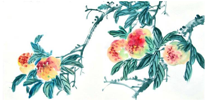
图：水墨画“寿桃”，作者：大陆大法弟子

由于我手中有一定的权力，又是领导干部，因此每到逢年过节下属单位和身边的同事就会给我送一些礼金、礼品之类的。修炼法轮功之前，我都是笑纳的，甚至每到年关跟前真的是惦记的：“这个单位怎么还不来啊？”随着修炼层次的提高，我渐渐认识到不应该那样做了，我就对他们说：“我修炼法轮功了，这些钱我不能要。”实在是非得给的，我就当作奖金发给下属员工。至于身边同事的