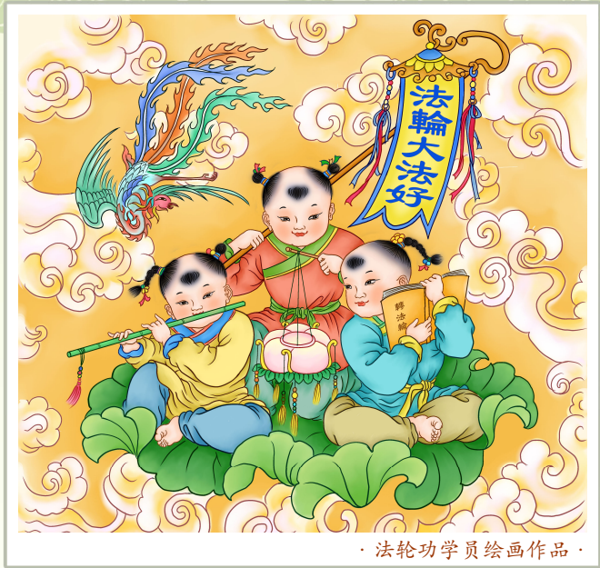
· 法轮功学员绘画作品 ·