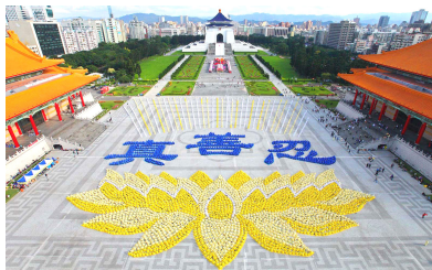
■ 2010 年 11 月 27 日，台湾·台北，5000 多位法轮功学员集体排字炼功。

法轮大法已传遍世界六大洲的 100 多个国家和地区，受到 100 多个国家和地区的人民们的喜爱和支持；法轮大法的主要著作也被翻译成三十多种语言，在世界各国、各民族中广泛传播。