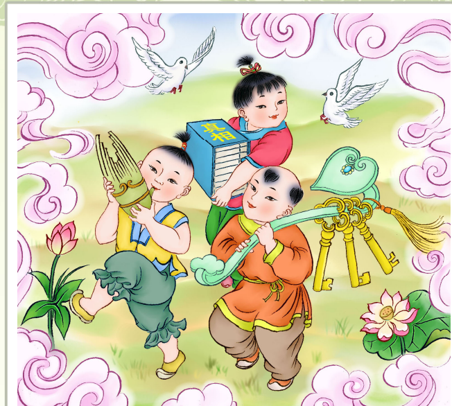
· 法轮功学员绘画作品 ·

http://minghui.org/mh/articles/2008/11/13/189226.html ）