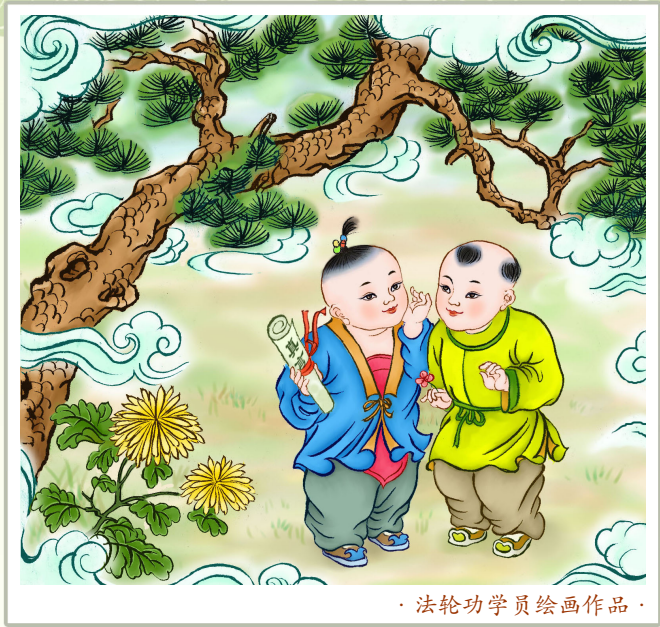
· 法轮功学员绘画作品 ·

（此文是缩减文，想看精彩全文，请访问明慧网： http://mhradio.org/showprogram/2576.html ）