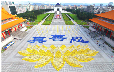
■ 2010 年 11 月 27 日，台湾·台北，5000 多位法轮功学员集体排字炼功。

法轮大法已传遍世界六大洲的 100 多个国家和地区，受到 100 多个国家和地区的人民们的喜爱和支持；法轮大法的主要著作也被翻译成三十多种语言，在世界各国、各民族中广泛传播。