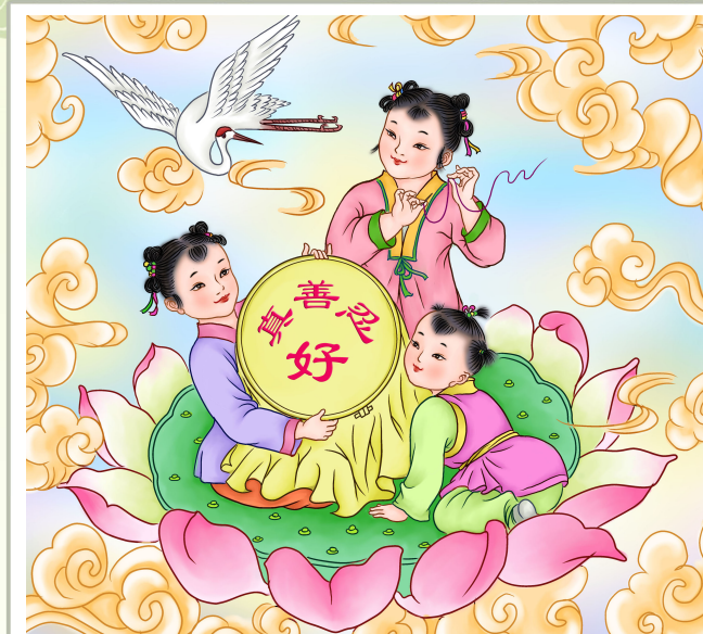
· 法轮功学员绘画作品 ·

2009 年 9 月 26 日，亚太人权基金会将“杰出精神领袖奖”授予法轮功创始人李洪志先生，并赞扬“真、善、忍”对净化人类的灵魂有着巨大的作用。