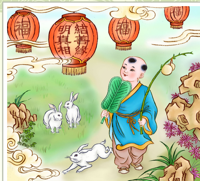
· 法轮功学员绘画作品 ·

http://minghui.org/mh/articles/2008/4/15/176499.html ）