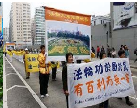
左图:多名社会各界知名人士在集会上发言 中图:法轮功学员的天国乐团游行队伍 右图:展示法轮大法弘传图片