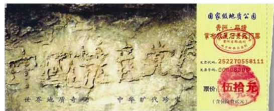
图：位于贵州省平塘县掌布风景区内的救星石景区的“藏字石”，石头上清晰可见的六个字是：中国共产党亡（此图为风景区门票）。

【明慧网】孔子是我国春秋时期的思想家、教育家，非常重视道德教化，善于从普通的事物或者现象中发现隐含其中的道理，善化他人。他通过对最平常的水的观察、感悟和思考，以伦理道德思想为切入点，来阐发对水的深刻理解和认识，给人以智慧的启迪。