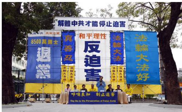
图：12 月 12 日香港各界声援 8500 万勇士退出中共

脑文化的围追堵截中，内心依然保持着一份清醒与良知，在遇到真相的时候，欣然了解真相，破除共产邪灵的多年思想禁锢，真名或化名公开声明退出中共，抹去毒誓，拥有生命的真实与自由。这样的人越来越多，现在已经有 8600 万，而且这个群体还在不断的扩大。