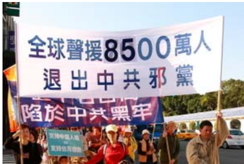
图：12月18日台湾声援8500万退党的

老同修听他这样说，当时就忍不住流下眼泪。中年男子不安地问她：“老太太，我一没打你，二没骂你，你哭什么？”老同修哭着说：“孩子啊，说心里话，大姨一回一回的跟你讲，全是为你好啊。如今全世界都知道，中共坏事做绝，天要灭它，眼看一场大灾难就要来了。入过党团队