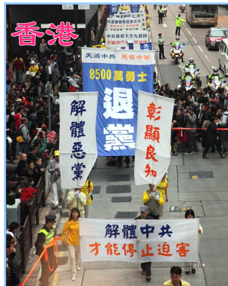
上图：在二零一零年的世界人权日期间，十二月十二日，香港法轮功学员举办的“护人权、反迫害”集会游行，受到社会各界的大力支持。

们却不知道因为迫害法轮功，给他们带来的将是什么！历史总是惊人的相似，但却不是简单的重演。在文革中好多公安、监狱的警察，为了讨好上级，拼命迫害那些共党的老干部；可文革一结束，这些警察却立即被共党抓到监狱里，甚至被枪毙了。法轮功弟子是以“真、善、忍”为修炼宗旨，不会对这些人怎么样；可是共产邪党崩溃在即，清算在即，而你们作为共产邪党的打手，迫害佛法，迫害走在神路上的修炼人，等待你们的那将是什么？你们自己想过吗？你们真的就只想把自己推到只顾眼前、放弃未来的绝路上去吗？