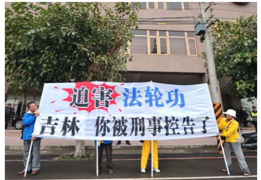
台中福华饭店外，“迫害法轮功，吉林你被刑事控告了！”

截至目前为止台湾已有立法院及高雄市、彰化县、苗栗县、花莲县、云林县、嘉义市、高雄县、