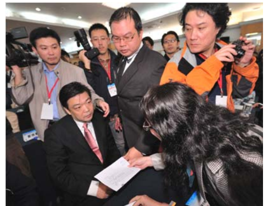
中共北京副市长吉林在数百人的会场上，对递到眼前的诉状，一脸愕然

台东县及嘉义县议会共九个地方议会通过议案，表达不欢迎任何违反国际人权的恶棍来台湾。吉林面临法轮功学员沿路揭发其丑陋恶行的强大压力，吉林闻风丧胆，狼狈难行，选择早早离台逃避，也可说是善恶有报的又一事证。