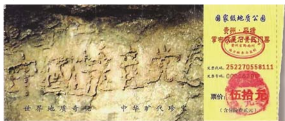
图：位于贵州省平塘县掌布风景区内的救星石景区的“藏字石”，石头上清晰可见的六个字是：中国共产党亡（此图为风景区门票）。

【明慧网】孔子是我国春秋时期的思想家、教育家，非常重视道德教化，善于从普通的事物或者现象中发现隐含其中的道理，善化他人。他通过对最平常的水的观察、感悟和思考，以伦理道德思想为切入点，来阐发对水的深刻理解和认识，给人以智慧的启迪。