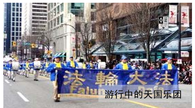
游行中的天国乐团

当天国乐团吹奏“法轮大法好”、“法鼓法号震十方”、“法正乾坤”、“送宝”等乐曲时，街道两边的观众仿佛都