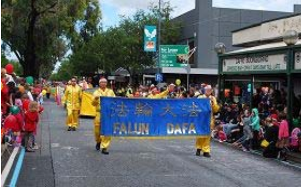
二零一零年十二月二十日、二十一日 南澳洲法轮功学员参加瑞武德圣诞游行

【明慧网二零一零年十二月二十四日】(明慧记者唐恩综合报导) 圣诞节, 是基督徒纪念耶稣基督降生的庆祝日。在西方国家, 圣诞节受重视的程度如同华人社会里的中国新年。近年来, 在海外的各种社区活动及国家节日庆典中, 法轮功被视为传统中华文化的代表而频繁受邀参加。法轮功学员的功法展示、大型军乐队(天国乐团)、腰鼓表演等向全球民众传递着“真善忍”的讯息, 而深受各国人民的喜爱。