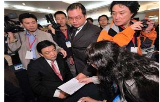
图：中共北京副市长吉林在数百人的会场上，对递到眼前的诉状，一脸愕然

根据追查迫害法轮功国际组织之追查通告和明慧网报导，吉林任北京密云县委书记时，为了政绩，积极追随江泽民集团，亲自策划、指挥对法轮功学员的迫害，过问每个被绑架法轮功学员的情况，并参与每个被迫害学员判决结果的审定，其大批绑架法轮功学员至劳教所、监狱迫害，使密云县成为北京市迫害最严重的地区。