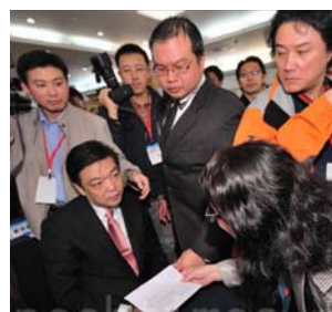
图: 中共北京副市长吉林在数百人的会场上, 对递到眼前的诉状一脸愕然。

(明慧记者郑语焉台湾台北报导) 积极参与迫害法轮功的中共北京副市长吉林, 12 月 13 日抵台, 15 日在台中与新竹两地亲