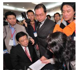
图:中共北京副市长吉林在数百人的会场上,对递到眼前的诉状一脸愕然。

(明慧记者郑语焉台湾台北报导)积极参与迫害法轮功的中共北京副市长吉林,12月13日抵台,15日在台中与新竹两地亲自接获刑事诉状后,突于晚间七时离开台湾。这是2010年8月以来,继广东省长黄华华、陕西代省长赵正永、宗教局长王作安以及湖北省委书记杨松之后,又一个残酷迫害法轮功的中共官员狼狈离开台湾。