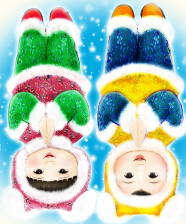
· 法轮功学员绘画作品 ·

听妈妈讲，我小时体弱多病，一出生就成了医院的常客。三岁时发高烧被抢救过来，可从此目光呆滞，反应迟钝。不久开始挤眼睛、面部抽搐，诊断结果是癫痫病。再后来脖子也抽搐，嘴向后咧，样子十分可怕。吃药不管用，可还得吃，七八种药倒在小手里都放不下。看我受苦，妈妈也整天以泪洗面。 由于药里有镇静剂，我整天无精打采、软弱无力。上一年级时，学校老师经常找我妈妈，说我每天上课趴在桌子上，头都抬不起来。妈妈怕老师、同学歧视我，欺负我，不敢讲实情。那时的生活多痛苦啊！ 万幸的是，1995年腊月，我和妈妈开始学炼法轮功。太神奇了！第二天我那些病态的动作就没有了，天目还开了。随着我炼功，模样也越来越俊秀、可爱；学习成绩上去了，年年被评为“三好学生”，老师、同学都非常喜欢我。看到我的变化，我们整个大家庭几乎都开始修炼法轮功。 现在我在一所名牌大学上学，1.82米的个子，长相帅气，多才多艺，是出了名的帅哥。是法轮功把我从一个残疾的傻孩子变成了一个绝对优秀的青年。我发自内心地感谢师父和大法。