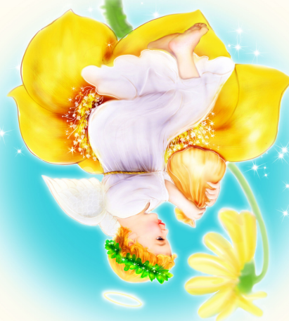
· 法轮功学员绘画作品 ·