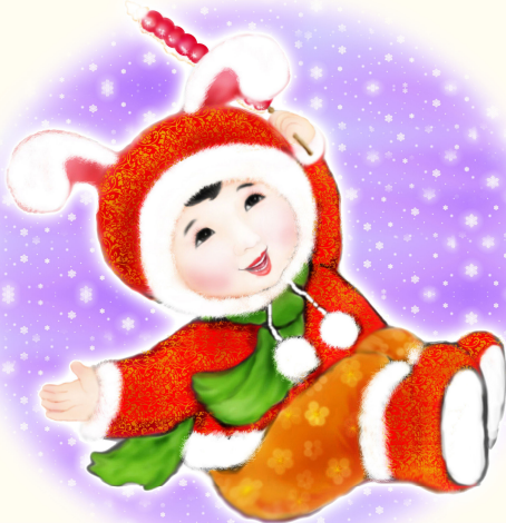
· 法轮功学员绘画作品 ·