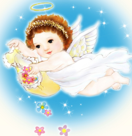
· 法轮功学员绘画作品 ·

我小时候，妈妈得脑血栓卧床不起，智力也退到几岁小孩的程度。爸爸为了偿还给妈妈治病欠的债，去了外国打工。家里只剩下残废的妈妈、年幼的哥哥和我。生活的不幸，造成我自闭的性格，经常一人闷在屋看武侠，天一黑就不敢出门，总看到黑东西跟着我。