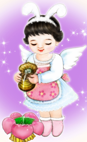
· 法轮功学员绘画作品 ·

2001 年除夕，天安门广场上五人自焚，中共谎称是法轮功所为，利用媒体全面炒作，在全世界煽动对法轮功的仇恨。但是自焚录像却暴露了十余个造假的破绽。