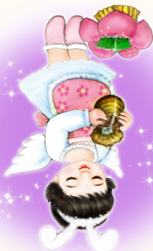
· 法轮功学员绘画作品 ·

2001 年除夕，天安门广场上五人自焚，中共谎称是法轮功所为，利用媒体全面炒作，在全世界煽动对法轮功的仇恨。但是自焚录像却暴露了十余个造假的破绽。 央视称：王进东自焚后，抱着的塑料瓶里盛的是汽油。为什么火烧之后塑料瓶不变形，汽油不爆炸？事后，央视资深记者李玉强被追问得张口结舌，不得不公开承认：“雪碧瓶子是她们放进去‘补拍’的。” 自焚中的小女孩，在做气管切开手术后的第 4 天，就接受央视采访。记者不穿隔离服就进了无菌室，气管切开后从脖子根呼吸，根本就无法说话了，但这小女孩竟然能在接受记者采访时对着麦克风唱歌！ 被央视声称烧死的刘春玲，在三名军警包围中，后脑生命中枢遭到“便衣”致命的一击。 2001 年 8 月 14 日，国际教育发展组织（IED）在联合国声明：“我们的调查表明，整个事件是由政府一手导演的。”面对确凿证据，在场的中共代表团哑口无言。该声明已被联合国备案。