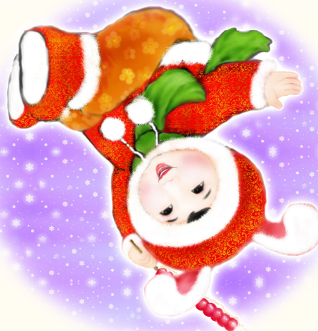
· 法轮功学员绘画作品 ·

1992 年～1999 年，法轮功传遍神州大地。亿万修炼者身心净化、道德升华。 1993 年北京东方健康博览会授予法轮功最高奖“边缘科学进步奖”，李洪志先生获“受群众欢迎气功师”称号；1997 年前后，国内一些新闻媒体如《医药保健报》，《羊城晚报》等，对法轮功的神奇功效及在国内弘传的盛况，做了公正客观的正面报导。 1998 年，国家体育总局组织医学界专家，对 3 万多名法轮功学员做了五次医学调查，表明法轮功祛病健身有效率高于 98%，学员心理状况较之未修炼之前也得到极大改善。同时，以乔石为首的老干部以“法轮功于国于民有百利而无一害”的调查结论，向中央做了书面汇报。 1995 年 3 月，李洪志先生应邀到法国传功讲法，开始了法轮大法在海外的传播。各国各地政府纷纷颁发褒奖、通过支持议案。至今已经获得各界褒奖 1632 项，支持议案 313 件。2009 年 9 月 26 日，亚太人权基金会将“杰出精神领袖奖”授予法轮功创始人李洪志先生，并赞扬“真、善、忍”对净化人类的灵魂有着巨大的作用。