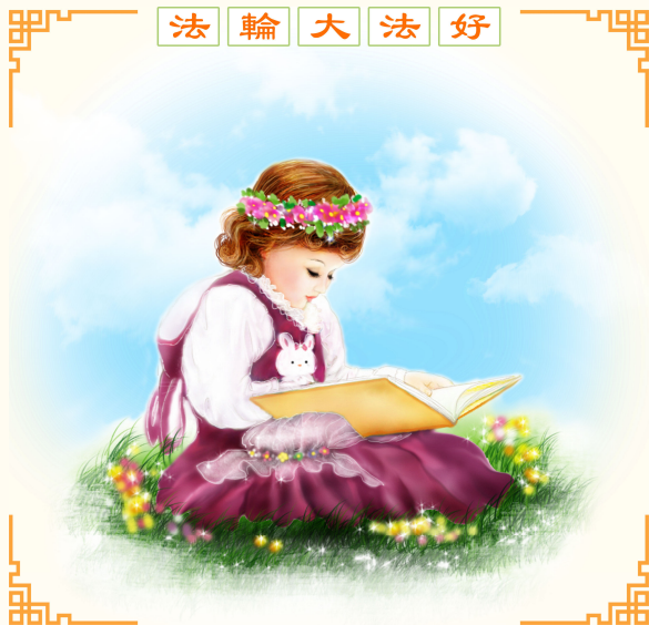
· 法轮功学员绘画作品 ·

从冰雪皑皑的格陵兰岛到赤日炎炎的非洲，从宁静的日月潭边到壮美的自由女神像前，从温馨的莱茵河畔到广袤的澳洲草原，从南美的高原平川到印度的恒河两岸……您都可以听到法轮大法悠扬宁静的炼功音乐，可以见到法轮功学员祥和徐缓的炼功场面。