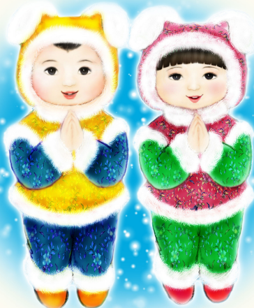
· 法轮功学员绘画作品 ·

听妈妈讲，我小时体弱多病，一出生就成了医院的常客。三岁时发高烧被抢救过来，可从此目光呆滞，反应迟钝。不久开始挤眼睛、面部抽搐，诊断结果是癫痫病。再后来脖子也抽搐，嘴向后咧，样子十分可怕。吃药不管用，可还得吃，七八种药倒在小手里都放不下。看我受苦，妈妈也整天以泪洗面。