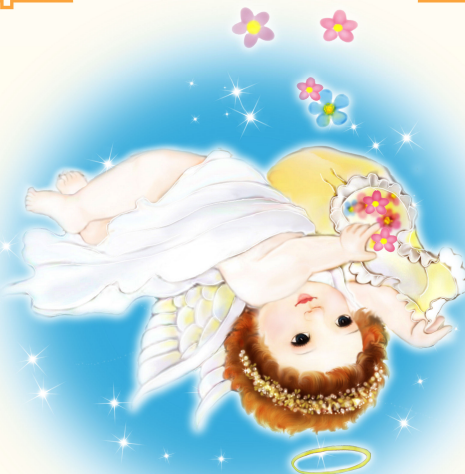
· 法轮功学员绘画作品 ·

我小时候，妈妈得脑血栓卧床不起，智力也退到几岁小孩的程度。爸爸为了偿还给妈妈治病欠的债，去了外国打工。家里只剩下残废的妈妈、年幼的哥哥和我。生活的不幸，造成我自闭的性格，经常一人闷在屋看武侠，天一黑就不敢出门，总看到黑东西跟着我。2002 年，哥哥开始炼法轮功。一次他被轿车拖走几米远，脸擦肿了，手脚也动不了，但第二天就全好了！看到这个事实，震惊之余，我还是固执地排斥法轮功真相传单。 一天早上睡醒觉，哥哥哭得眼睛通红的问我：最近是不是骨头痛？我大吃一惊：他怎么知道？我骨头痛了好几个月了，有时晚上痛得睡不着。哥哥说昨晚梦到我得了××病（类似骨癌），已经到寿了。但因身边有修大法的人，再给我半年机会，如果能用心炼法轮功，就能活过来。他还看到我背部骨骼全是黑的。 我只有炼法轮功了。那时离高考还有半年，我不再上晚自习，每晚在家学《转法轮》，炼功。半年时间，我真的重生了！变得真诚、善良、宽容，身体也健康了。更神奇的是，成绩平平的我在高考时考了班级第二，上了理想的大学，并获得奖学金。妈妈也因用心念“法轮大法好”，恢复正常了。大法给了我们全新的人生！