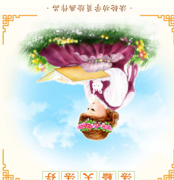
· 法轮功学员绘画作品 ·

从冰雪皑皑的格陵兰岛到赤日炎炎的非洲，从宁静的日月潭边到壮美的自由女神像前，从温馨的莱茵河畔到广袤的澳洲草原，从南美的高原平川到印度的恒河两岸……您都可以听到法轮大法悠扬宁静的炼功音乐，可以见到法轮功学员祥和徐缓的炼功场面。今天，法轮大法的主要著作已被翻译成 30 多种语言，法轮大法已传遍世界六大洲的 100 多个国家和地区，受到 100 多个国家和地区的人民的喜爱和支持，法轮大法弘传世界的现实，就是这样震撼着人心…… 1999 年 7 月，中共掀起了又一场祸害人民的运动，宣布“三个月内消灭法轮功”。然而 11 年来，“真、善、忍”的信仰者们，顶着巨大的压力抵制迫害，和平理性地向人们讲述着真相，得到了越来越广泛的支持。至今已在国际上获得各界褒奖、政府支持议案、信函 3000 余件，“真、善、忍”的美好传遍了世界…… 这样超越苦难的坚定意志从何而来？为何中国大陆的法轮功学员，不畏强权威压，还要向您说出真心话？ 请您来了解这些被掩盖的真相，这里凝聚着对您最诚挚的祝福和最美好的祝愿！