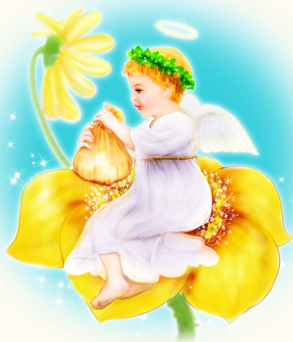
· 法轮功学员绘画作品 ·

“就卡你孩子，叫她没学上，没饭吃，看你还炼？”九年前，警察绑架我父母时喊出了这句话。