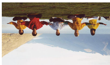
图：新西兰学员晨练 →

http://minghui.org/mh/articles/2008/11/13/189226.html )