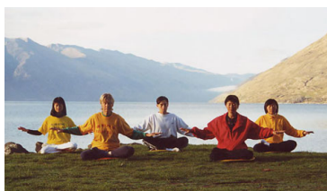
图：新西兰学员晨炼 →

http://minghui.org/mh/articles/2008/11/13/189226.html