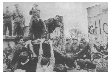
1989 年 11 月柏林墙被拆除的瞬间

辩护律师称，这些士兵是执行命令的人，他们根本没有选择的权利。不过这样的辩护最终没有得到法官的认可。因为类似的辩护，早在第二次世界