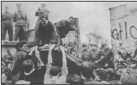
1989 年 11 月柏林墙被拆除的瞬间

故事发生在柏林墙倒塌之后的德国。一九九二年二月，统一后的柏林法庭上，举世瞩目的柏林围墙守卫案将要开庭宣判。这次接受审判的是四个年轻人，