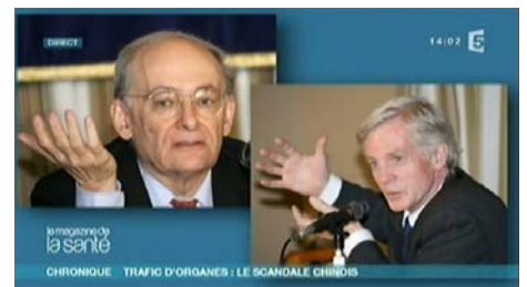
■ 大卫·麦塔斯（左）和大卫·乔高在电视荧屏上

因撰写《血腥的器官摘取》一书，乔高两周前在瑞士伯尔尼（Bern）获得了由世界人权组织颁发的人权奖。在此书中，这位前国务秘书（亚太司司长）用曾被关押的犯人报告和其它证据，论证了他对中共的指证。◇