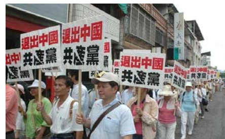
至2010年2月8日已有6821万中国民众退出中共党、团、队

现在人们真的越来越认清了这个党的“假恶暴”的本质。有时候打开网站，看见只要是官方发的消息，无论是新闻还是什么政策，点开网友的评论看看，没有几个不骂的，中共政府与民众之间的冲突事件越来越多。周围的同事，只要是谈及现在的政府、官员，也没有不骂的。很多人都在底下谈论《九评共产党》一书。有一次我到一办公室去办事，一进去，看到几个人正在那儿谈论着什么，办公室主任和我很熟，见了我就说：来来，昨晚我看了一本书，叫《九说共产党》（我心里好乐，他是把《九评》记成《九说》），说得真好！他以为我还不知道《九评》，接着就给我讲了其中“几说”的内容，旁边几个人还不时地给予补充。