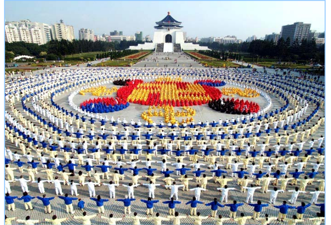
法轮大法弘传台湾：4千多名法轮功学员在台北市中正纪念堂广场前排组法轮图形（2005.12）

至今，法轮大法已弘传世界110多个国家和地区，获各国政府褒奖、支持议案信函3000多项。法轮功的主要书籍《转法轮》被翻译成30多种语言文字，在全世界出版发行，并可从互联网上免费下载。《转法轮》成为世界上流行最广的书籍之一。