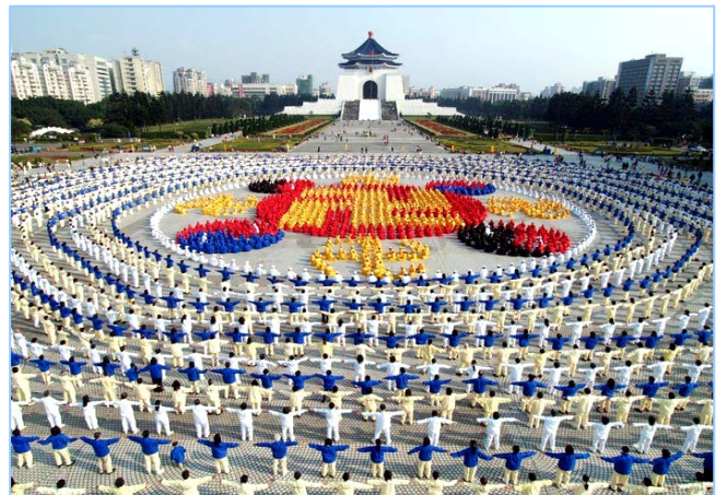
法轮大法弘传台湾：4千多名法轮功学员在台北市中正纪念堂广场前排组法轮图形（2005.12）

至今，法轮大法已弘传世界110多个国家和地区，获各国政府褒奖、支持议案信函3000多项。法轮功的主要书籍《转法轮》被翻译成30多种语言文字，在全世界出版发行，并可从互联网上免费下载。《转法轮》成为世界上流行最广的书籍之一。