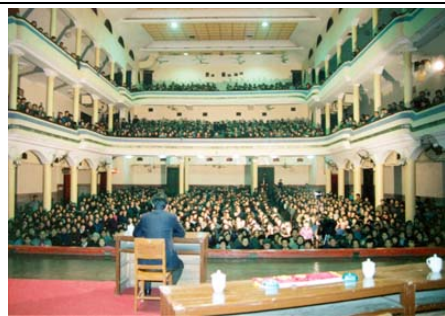
李洪志先生在武汉第二期传 授班上传功（1993.3）

有一天从十二期班下课回家，在五棵松地铁站等车，看到老师从后面走来，旁边有他的家人，还