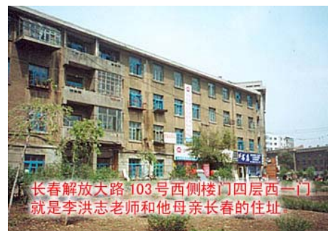
李老师在长春的住宅

忽然，这位长春学员指着远处说：“快看，那是老师的家！”我们顺着她手指的方向望去，是一栋极普通的没贴面的砖楼，顶多四、五层