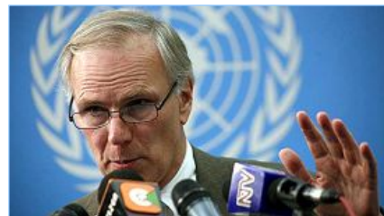
联合国特派专员菲利普·奥尔斯顿先生（Mr. Philip Alston）在联合国总部的新闻发布会上

联合国特派专员菲利普·奥尔斯顿先生（Mr. Philip Alston）在最新发表的全球报告中，特别提出法轮功学员在中国被关押期间遭酷刑致死的严重情况。他呼吁中国政府：“必须对所有不经过正式起诉的非法任意处决的可疑案件进行彻底、迅速且公正的调查，包括亲属的投诉及在上述情况认定为非自然死亡的其它可靠的报告。”