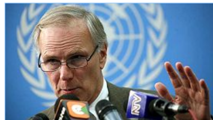
联合国特派专员菲利普·奥尔斯顿先生（Mr. Philip Alston）在联合国总部的新闻发布会上

联合国特派专员菲利普·奥尔斯顿先生（Mr. Philip Alston）在最新发表的全球报告中，特别提出法轮功学员在中国被关押期间遭酷刑致死的严重情况。他呼吁中国政府：“必须对所有不经过正式起诉的非法任意处决的可疑案件进行彻底、迅速且公正的调查，包括亲属的投诉及在上述情况认定为非自然死亡的其它可靠的报告。”