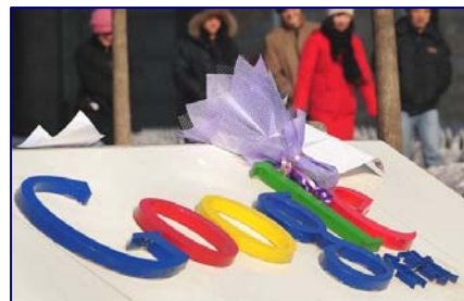
谷歌 1 月 12 日通过官方博客宣布，由于在中国的服务器以及人权活动人士的帐户遭到长期网络攻击，并对中共要求过滤搜索引擎的不满，谷歌可能全面退出中国。民众在谷歌北京公司门前献花支持。

中共靠谎言与暴力起家，所以它不需要有人性、有思想的人，因为他们会认识到它的邪恶。它需要的是一个肉体与思想上的奴隶，只有唯其是听的，即所谓和它保持高度一致的，才能合其心意，为此，即使是明抢暗偷，欺压百姓，甚至杀人放火，也就都是合其法的了。那么，我们也就明白了：活体摘取法轮功学员器官的罪恶，何以能在光天化日之下进行；它为什么残酷迫害信仰“真善忍”的