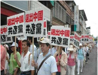
■ 截至2010年2月8日已有6874万中国民众退出中共

来应该是工程师的，因修炼法轮功受迫害，造成职称起起落落的，但别人都习惯这么称呼我），祝你成功！我知道他意思，每次都笑着回答他：谢谢你吉言！