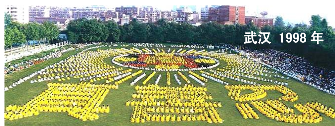
武汉 1998 年

翻译成 30 多种文字，在全世界出版发行，并可从互联网上免费下载，成为世界上流行最广的书籍之一。2009 年 9 月 26 日，亚太人权基金会“人权领袖奖”颁奖典礼在美国洛杉矶鲍温公园市隆重举行，法轮功创始人李洪志先生获得“杰出精神领袖奖”。