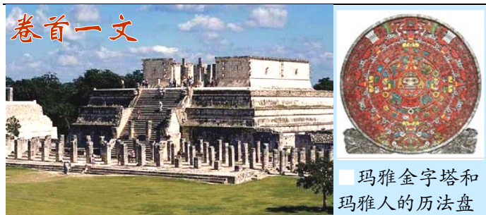
玛雅金字塔和 玛雅人的历法盘