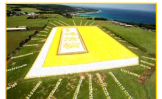
五月九日，台湾六千多名法轮功学员排演《转法轮》一书。

“东德的法律要你杀人，可是你明明知道这些唾弃暴政而逃亡的人是无辜的，明知他无辜而杀他，就是有罪。这个世界在法律之外，还有‘良知’这个东西。当法律和良知冲突的时候，良知是最高行为准则，不是法律。尊重生命，是一个放诸四海皆准的原则；你早在做围墙卫兵之前就应该知道，即使东德国法也不能抵触那最高的良知原则。”（转下页）