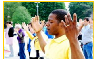
今年五月法国法轮功学员在庆祝活动中集体炼功。