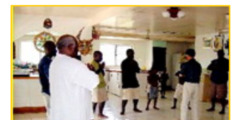
南太平洋岛国—巴布亚新几内亚前副总理及家人学炼法轮功

内蒙古图牧吉劳教所是内蒙古自治区劳教局的直属单位，位于兴安盟扎赉特旗境内，地处内蒙古、吉林、黑龙江三省交界处的偏远、贫穷的牧区，人烟稀少，那里的人多是警察的亲属。图牧吉劳教所拥有十三个科室，管辖：一个牧场，下设七个大队；一个监狱，下设一监区、二监区；两个劳教队，分男队、女队，劳教队是大队，下设中队。