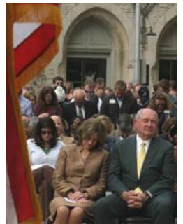
■普度夫妇在祈雨仪式上虔诚祷告

近年来大陆各种天灾人祸层出不穷，这已经是上天对中共的谴责。而很多中外预言都提到，天灾中共时会有一场更大的灾难来临。如何才能平安度过劫难？如今已经有超过 6800 万的中国同胞做出了理智的选择——退出中共党、团、队组织，废除了把生命献给中共的毒誓。生命极其珍贵，机缘也许只有一次，在中共气数将尽之际，希望同胞们都能顺应天意，远离灾难，选择平安。◇