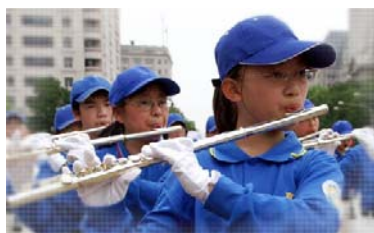
■ 有卉用业余时间刻苦练习演奏，为了用长笛告诉人们“法轮大法好”。

李老师更提到“打不还手，骂不还口”的道理，我从理解到高尚的道德标准内涵，书中每篇文章不但告诉我们做人的道理，也让我在日常生活中，不管是在家里、还是学校都有帮助。每当在学校和同学发生矛盾时，我就想到书中的话，就此勉励自己，平稳自己的情绪，这本书让我从爱发脾气的小女生，变得更温柔、懂事、体贴，让我每天快乐的学习，和人和平相处，真是一本值得更多人阅读的好书！（文 / 张子涵）◇