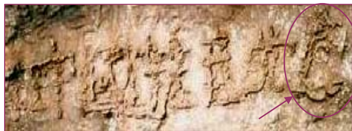
■贵州平塘县掌布乡桃坡村掌布河谷发现了有2.7亿年的“藏字石”，巨石断面内惊现六个大字“中国共产党亡”

2004年11月18日，《大纪元时报》开始发表系列社论《九评共产党》，揭露了中共几十年暴政血腥史，翻开历史中共“土改”、“三反”、“五反”、“镇反”、“肃反”、“反右”、“大跃进”、“文革”、“六四”、“迫害法轮功”，在历次政治运动中被中共无