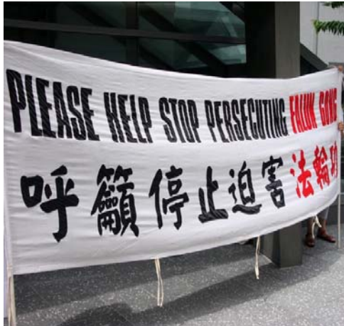
澳洲布里斯本法轮功学员于向 120 名重庆市政府代表团员传递真相

【明慧网二零一零年二月二十二日】二零一零年二月十八日下午，一百二十名重庆市政府代表团员，在澳洲布里斯本 Sebel 饭店，与布里斯本市长纽曼重新签署姊妹城市协议。昆士兰法轮功学员在饭店外高举横幅，将中国法轮功学员所遭受的迫害真相传递给该代表团。