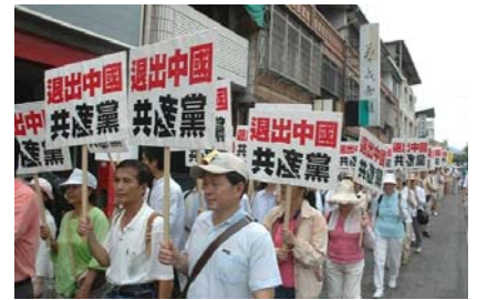
截至2010年2月8日已有6821万中国民众退出中共党、

表姐夫四十多岁，是县某机关一个局长，这次持续高烧七、八天了，怎么打针吃药输液就是不管用，持续四十多度高烧不退，表姐一家都急坏了。我听说