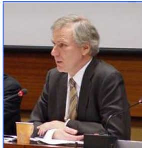
■ 特派专员菲利普-奥尔斯顿先生在日内瓦联合国会议期间聆听证人的发言

【明慧网】中共政权非法任意处死受关押者一直是遭世界谴责的人权犯罪，近年来大批法轮功学员被迫害致死更是引起关注。在联合国特派专员菲利普-奥尔斯顿先生（Mr. Philip Alston）二零零九年提交联合国的年度报告中，法轮功学员被迫害致死问题备受关注。在报告中，菲利普-奥尔斯顿先生列举了他向中国政府征询的二十个案例，其中十六个是法轮功学员被迫害致死的案例。