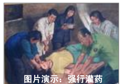
图片演示：强行灌药

中共的劳教所用尽了所有邪恶的手段，企图摧毁大法弟子的信仰、意志和身体，但它们想不到的是，这些坚信宇宙真理、在大法中从新熔炼过的新的生命是坚不可摧的。◇