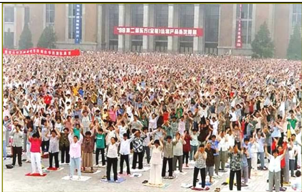
沈阳市法轮功学员辽宁工业展览馆晨炼（1998）

1998年10月20日，国家体总派到长春和哈尔滨的调研组组长发表讲话说：“我们认为法轮功的功法功效都不错，对于社会的稳定，对于精神文明建设，效果是很显著的。”