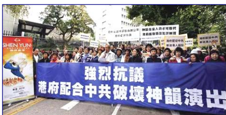
香港各界一月二十六日集会游行抗议港府胁停神韵演出

英国上院阿维伯瑞勋爵（Lord Avebury）认为：中共当局是港府拒绝神韵关键技术人员签证事件的元凶。香港在九七回归后，根本没有贯彻中共当局之前所保证的「一国两制」制度。