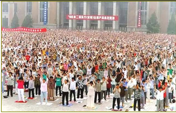
沈阳市法轮功学员辽宁工业展览馆晨炼（1998）

1998年10月20日，国家体总派到长春和哈尔滨的调研组组长发表讲话说：“我们认为法轮功的功法功效都不错，对于社会的稳定，对于精神文明建设，效果是很显著的。”