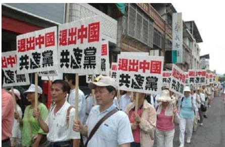
■ 截至 2010 年 2 月 8 日已有 6821 万中国民众退出中共党、