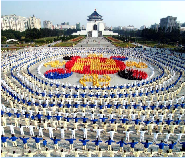
法轮大法弘传台湾：4 千多名法轮功学员在台北市中正纪念堂广场前排组法轮图形（2005.12）

至今，法轮大法已弘传世界 110 多个国家和地区，获各国政府褒奖、支持议案信函 3000 多项。法轮功的主要书籍《转法轮》被翻译成 30 多种语言文字，在全世界出版发行，并可从互联网上免费下载。《转法轮》成为世界上流行最广的书籍之一。