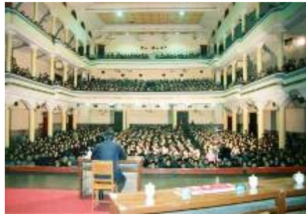
李洪志先生在武汉第二期传授班上传功（1993.3）

在学习班上，我仔细地观察老师，只要老师在场，我的眼睛就不离开，每一个音容笑貌，每一个细小的动作，都看在眼里，放在心上。所以下课了