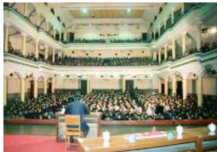
李洪志先生在武汉第二期传授班上传功（1993.3）

在学习班上，我仔细地观察老师，只要老师在场，我的眼睛就不离开，每一个音容笑貌，每一个细小的动作，都看在眼里，放在心上。所以下课了