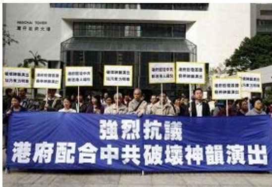
■香港市民到人民入境处大楼抗议,表达对港府配合中共破坏神韵的强烈不满。

金钱各方面都搭上。同时还有这么多港人买了票,看不到演出,这个损失是很大的,尤其对神韵团来讲是非常大的经济损失,如果我想这是几年前吧,中共还没有过来香港的话,也许这件事情不会出现。”