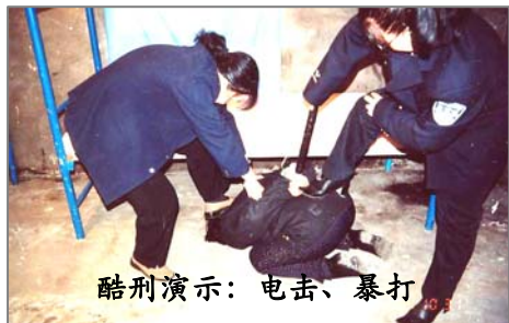
酷刑演示: 电击、暴打