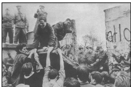
1989 年 11 月柏林墙被拆除的瞬间

故事发生在柏林墙倒塌之后的德国。一九九二年二月，统一后的柏林法庭上，举世瞩目的柏林围墙守卫案将要开庭宣判。这次接受审判的是四个年轻人，都三十岁不到，他们曾经是柏林墙的东德守卫。