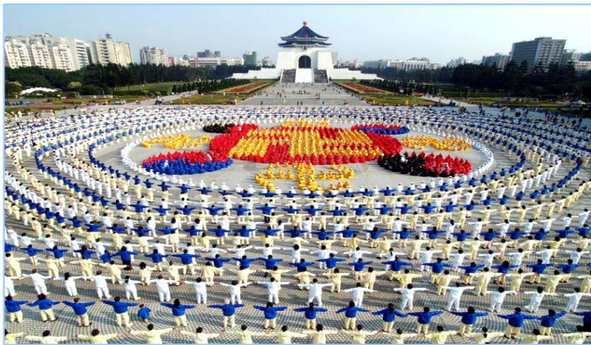
法轮大法弘传台湾：4千多名法轮功学员在台北市中正纪念堂广场前排组法轮图形（2005.12）

自 2002 年 10 月以来，海外法轮功学员以“群体灭绝罪、酷刑罪、反人类罪”控告迫害元凶江泽民及其帮凶。古语道：邪不胜正，得道多助，失道寡助，包括 610 办在内的江氏流氓集团及协从者灭绝人性地迫害按真、善、忍做好人的法轮功学员，其手段之卑鄙，性质之恶