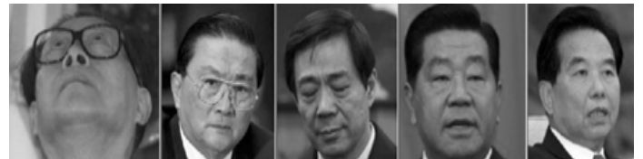
图左起）五名迫害法轮功的中共元凶。法院通知书表示，若被告的罪名成立，将面临至少二十年徒刑，

2009 年 11 月，西班牙国家法庭做出了一项史无前例的裁定，决定以“群体灭绝罪”及“酷刑罪”，起诉江泽民、罗干、薄熙来、贾庆林、吴官正（下