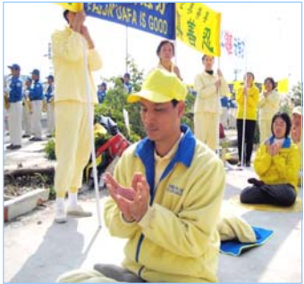
游住盟参加集体炼功 讲真相活动