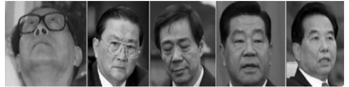
图左起）五名迫害法轮功的中共元凶。法院通知书表示，若被告的罪名成立，将面临至少二十年徒刑，

2009 年 11 月，西班牙国家法庭做出了一项史无前例的裁定，决定以“群体灭绝罪”及“酷刑罪”，起诉江泽民、罗干、薄熙来、贾庆林、吴官正（下