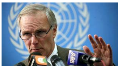
■ 特派专员奥尔斯顿先生在联合国总部新闻发布会上