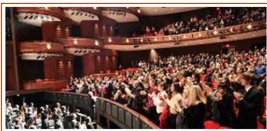
▲2010 年 1 月 15 日晚，神韵亚特兰大首场演出获得两千观众的满堂喝彩。演出结束时，观众全体起立，向神韵演员鼓掌致意。

肆虐六十载，杀戮无数，加上共产党文化嗜仇恨、嗜虚假、嗜贪腐，所以邪毒很盛，影响大陆人的日常生活的党文化邪毒灌之于物，是毒奶粉、毒大米、毒玩具、毒酒、毒油、毒烟等等；灌之于人是形形色色治不好、又说不出来的瘟疫、流行病等等，过去的非典，今天的“甲流”，都是例证。神韵演出，充满正气。看了神韵，会大大的提升人的正气，清除中共党文化的邪毒，真能给人带来吉祥和顺。