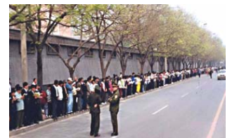
“4·25”现场，法轮功学员文明安静，警察不用维持秩序在一旁聊天。

●“4·25”上访经过简要：1999年4月11日，中共公安部长罗干的连襟何祚庥，在天津教育学院《青少年科技博览》杂志发表了题为“我不赞成青少年炼气功”的文章。该文以捏造事实的教育学院及相关机构反映实情。23日和24日，天津市公安局动用防暴警察殴打和非法逮捕法轮功学员，致使学员流血受伤，45人被抓。法轮功学员在天津市政府被告知：公安部介入了这个事件，你们去北京才能解决问题。出于对政府的信任，法轮功学员4月25日自发来到北京府右街附近的国务院信访办。当日，在国务院总理的直接关注下，合理解决了天津暴力抓人事件。晚上学员们散去时，地上一片纸屑都没有，连警察扔的烟头都给捡起来了。法轮功学员所表现出的和平理性和对正信与公义的坚守，得到了国际社会的高度评价，“4·25”上访被称作“中国上访史上规模最大、最理性平和、最圆满的上访”。4·25当晚，江泽民出于妒忌，强行推翻政府总理的开明决定，把和平上访歪曲成“围攻中南海”，并于1999年7月开始全面迫害法轮功。