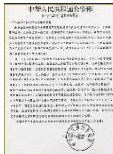
公安部所属中华见义勇为基金会致信感谢李洪志先生

●1993年8月31日，公安部所属中华见义勇为基金会致信中国气功科学研究会对李洪志大师表示感谢，感谢李洪志先生为全国第三届见义勇为先进分子表彰大会代表免费提供康复治疗。1993年9月21日，中国公安部主办的《人民公安报》刊登报导《法轮功为见义勇为先进分子提供康复治疗》，称公安部见义勇为先进分子